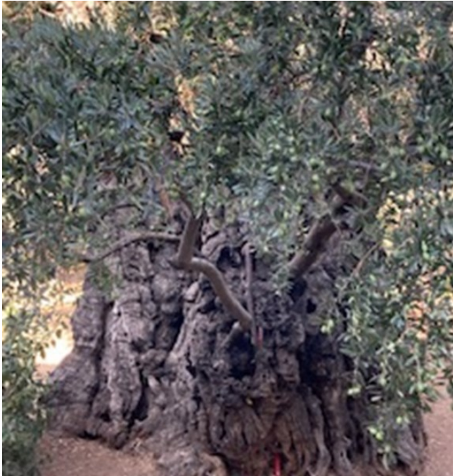
Árboles de 2000 años de antigüedad que siguen dando frutos.