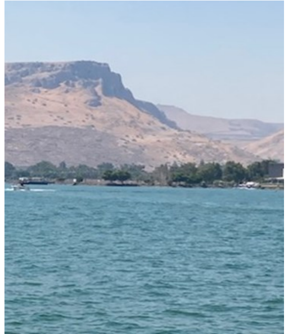
Mar de Galilea